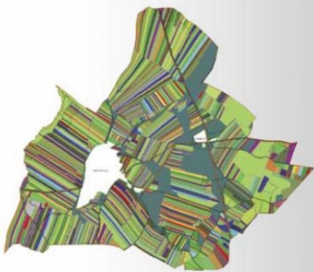
Stav půdní držby před pozemkovou úpravou